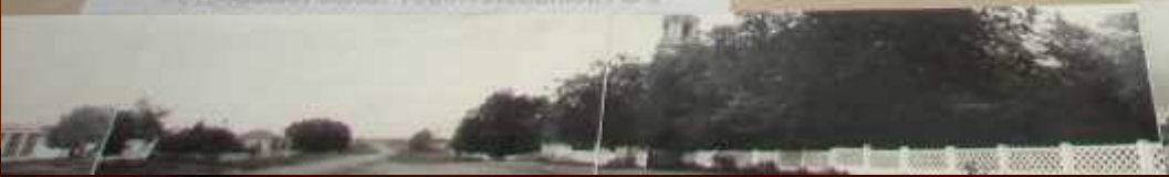
Фотосессия села. 1940-е. Пеманов А.А.