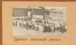
Школа в селе