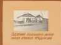
Школа в селе