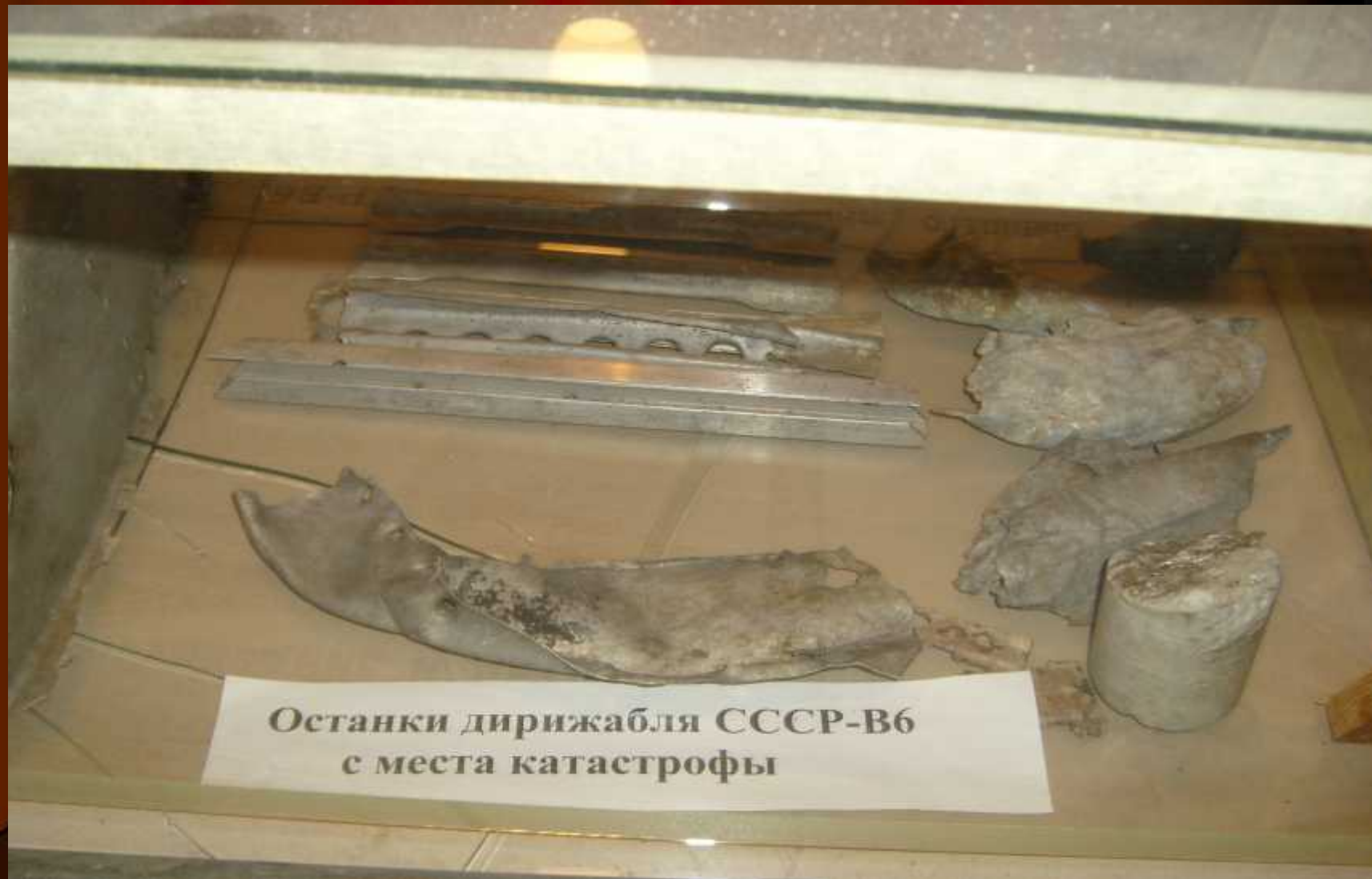
Останки дирижабля СССР-В6 с места катастрофы