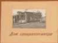
Школа в селе

ПЕРВЫМИ ЖИТЕЛЯМИ НАШЕГО СЕЛА БЫЛИ НЕКОТОРЫЕ МОЗОВСКИХ СЕМЕЙ ИЗ ПОД ПЕНЗЫ. МЕСТОМ ПОСЕЛЕНИЯ ОНИ ВЫБРАЛИ ЛЕВЫЙ БЕРЕГ ТАКОЙ РЕЧКИ СОКОЛ, ГДЕ И НАЧАЛИ ЗАНИМАТЬСЯ ХЛЕБОПАСАДСТВОМ И ЖИВОТНОВОДСТВОМ. ПОЗДНЕЕ СТАЛИ СЕЛЫТСЯ ЗДЕСЬ И РУССКИЕ. НАКАНУНЕ РЕВОЛЮЦИИ ЭТО ПОСЕЛЕНИЕ СТАЛО УЖЕ БОЛЬШИМ СЕЛОМ С ЦЕРКОВЬЮ, ДВУМЯ ШКОЛАМИ И ЖЕ- КО ВЫРАЖЕННЫМ СОЦИАЛЬНЫМ РАССЛОЕНИЕМ КРЕСТЬЯН.