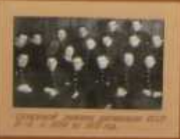
Семья пилота самолета-биплана.