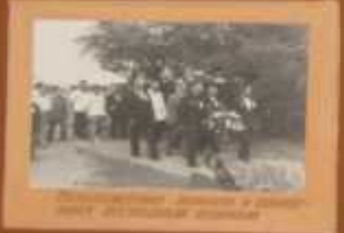
Солдаты в движении в июле 1941 года