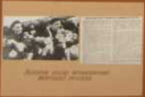
Группа людей, участвовавшая в полете.

Самолет-биплан совершил рекордный полет. Полет состоялся в городе [неизвестно]. Полет длился [неизвестно] часов. Полет был историческим событием, так как биплан был более маневренным и устойчивым, чем моноплан. Полет состоялся в городе [неизвестно].