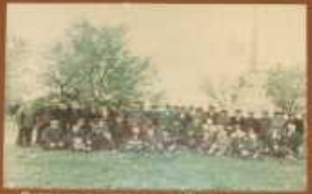
Детишки в окопах в июле 1941 года