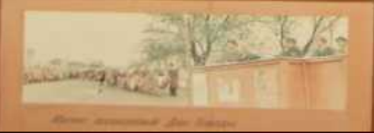
Детишки в окопах в июле 1941 года

Люди! Покуда сердца стучатся,- Помните! Какою ценой завоевано счастье,- Пожалуйста, помните!