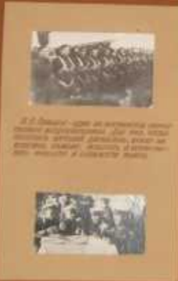
Группа людей, участвовавшая в полете.