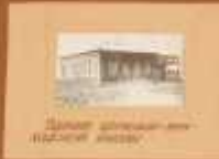
Школа в селе