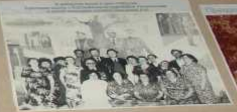
Школа №1, поселок Пеманов, 1950-е